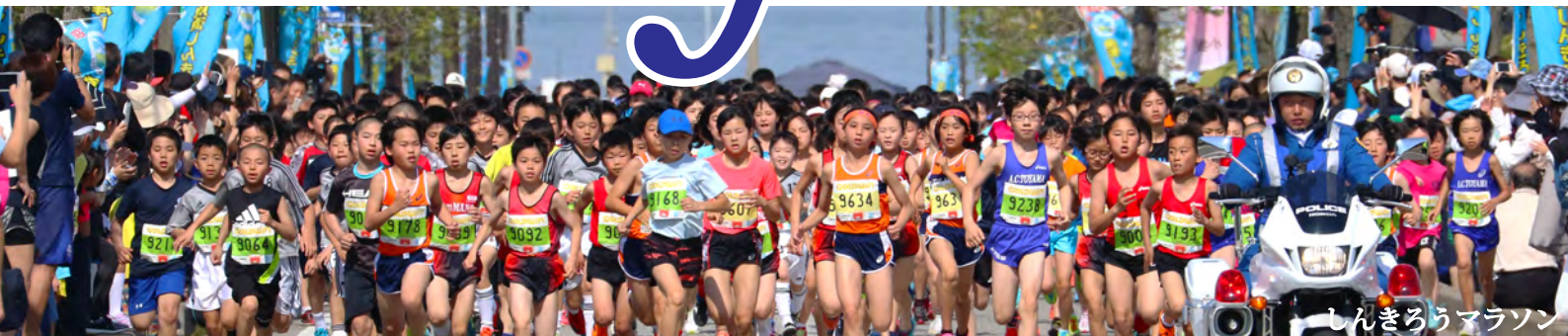
しんきろうマラソン