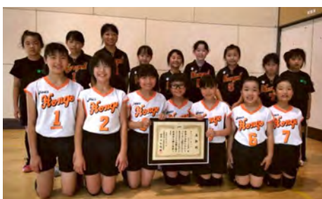
本江バレースポーツ少年団 魚津市スポーツ少年団