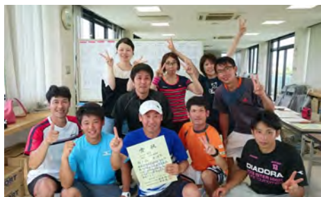
魚津市テニス協会チーム 魚津市テニス協会