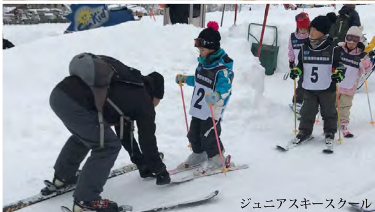
ジュニアスキースクール