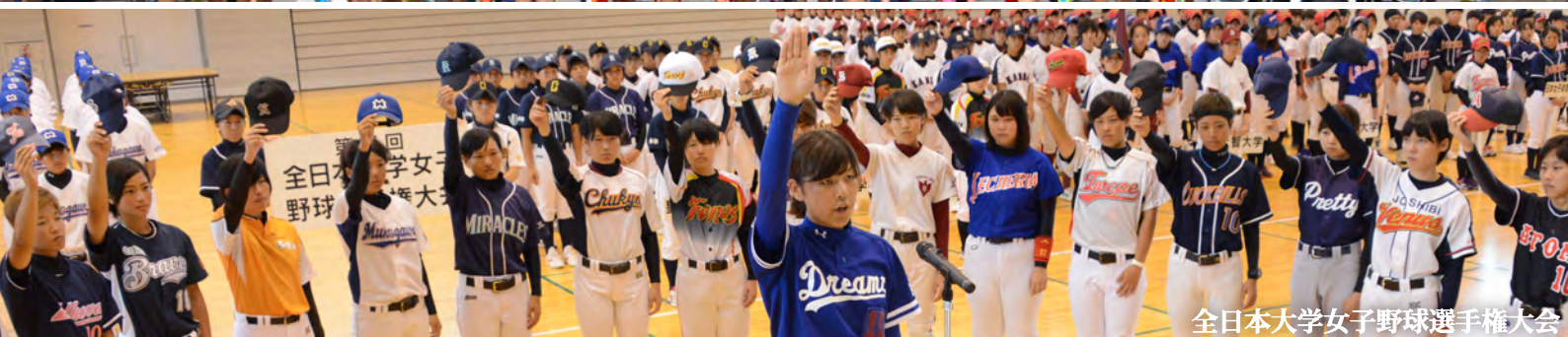
全日本大学女子野球選手権大会