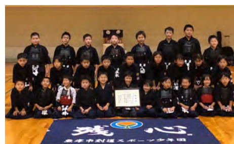
魚津市剣道スポーツ少年団 魚津市スポーツ少年団