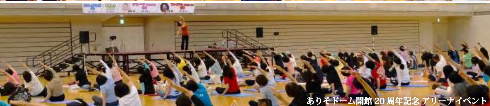
ありそドーム開館20周年記念アリーナイイベント