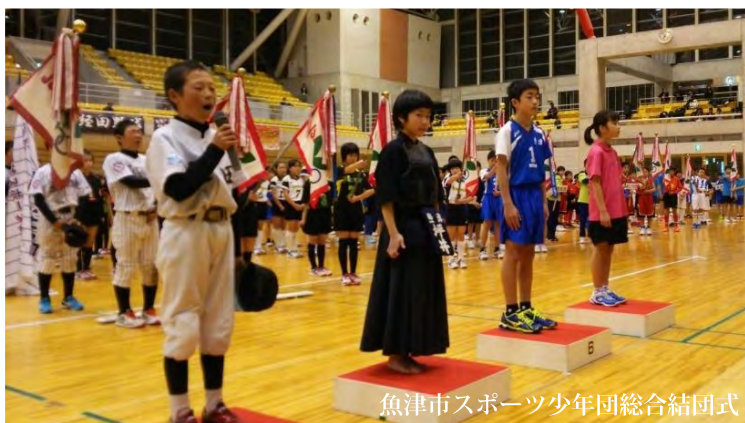
魚津市スポーツ少年団総合結団式